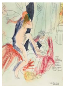
Stars Will Continue 2015 28,1 x 21 cm pencil, colour pencil, oil pastel, dry pastel and ink on paper