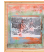
... Niet in Vraag Gesteld te Worden (... Not to be Questioned) 2015 166 x 141 cm mixed media on PVC mounted with steel screws in wooden frame