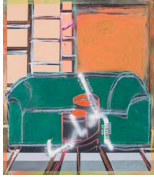
We Mikken op Elegantie (Setting the Elegance) 2015-2016 125,5 x 109 cm acrylic, pastel, spray paint, letters on PVC mounted on wooden board with steel screws