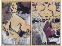
De Wereld aan een Draad (World on a Wire) 2015-2016 84 x 111 cm acrylic paint on digital prints on Plexiglass, mounted on wooden board with metal screws