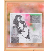
De Verhouding van de Dingen (The Relation of Things) 2015 166 x 141 cm mixed media on PVC mounted with steel screws in wooden frame