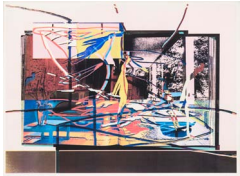
Verborgen Lagen (Hidden Layers) 2014 62,5 x 84,8 cm 4 colour screen prints on paper, hand printed by the artist, Simili Japon 225gr Edition of 3