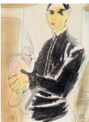
Our Stelliferous Era 2015 28,1 x 21 cm pencil, colour pencil, oil pastel, dry pastel and ink on paper