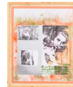
Overtuigend Bewijs (Conclusive Proof) 2015 166 x 141 cm mixed media on PVC mounted with steel screws in wooden frame