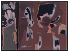
Liefde is Kouder dan de Dood (Love is Colder than Death) 2015-2016 84 x 112 cm acrylic paint on digital prints on Plexiglass, mounted on wooden board with metal screws