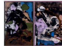
Bittere Tranen en Wederopstanding (Bitter Tears and Resurrection)

acrylic, spray paint on black PVC and digital print on Plexiglass mounted on wooden board with steel screws