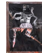
Als een Swastika (Tibet)

acrylic paint on digital prints on Plexiglass, mounted on wooden board with metal screws