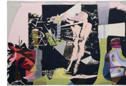
Van Vlasselaer 2016 195 x 290 cm cotton tapestry Edition of 2