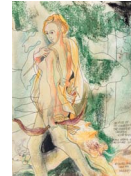
In Spite of Complexity 2015 28,1 x 21 cm pencil, colour pencil, oil pastel, dry pastel and ink on paper