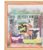
Draagwijdte en Noodzaak van een Uiteindelijke Aantrekkingskracht (The Extent and Necessity of a Final Appeal) 2015 166 x 141 cm mixed media on PVC mounted with steel screws in wooden frame